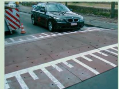
Verhoogd plateau - Gent in Belgium

All information is correct at time of going to press. © Rosehill Polymers Limited - 2016