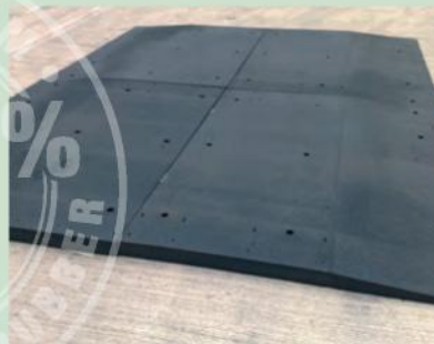
Verhoogd plateau Heathrow

Width of the panel is custom-adjusted to fit the road width.